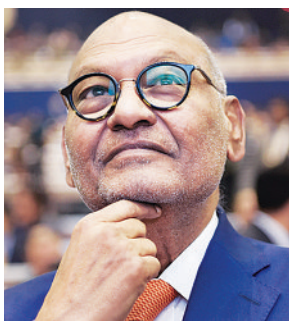
Agarwal, the founder of Vedanta Resources, is raising capital from international investors to buy stakes in government firms being sold under India's ₹1.1 trillion ($28 billion) divestment programme, Bloomberg

He is working with London-based Centricus Asset Management on the fund, which will have a 10-year life span and use a private equity-type strategy, according to another person. He plans to buy companies over a five-year period and then boost their profitability before seeking an exit, the person said.