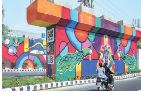
Commuters pass by a mural designed in preparation for the G20 Summit near Pragati Maidan in Delhi

Later, the spouses will pro-Gate, home to the National Gallery of Modern Art (NGMA), to